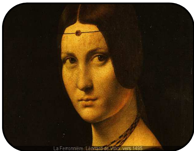
La Ferrière - Léonard de Vinci vers 1495

Cette rétrospective inédite de la carrière de peintre de Léonard permettra de montrer combien il a mis la peinture au-dessus de tout et comment son enquête sur le monde, qu'il appelait « la science de la peinture », fut l'instrument de son art, dont l'ambition n'était rien moins que d'apporter la vie à ses tableaux.